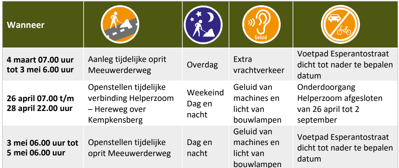
Tabel Werkzaamheden en hinder tot 6 mei 2024

De data zijn onder voorbehoud. Werkzaamheden met de vermelding 'Overdag' en overige werkzaamheden voeren we uit op maandag tot en met zaterdag tussen 07.00 uur en 19.00 uur. Wilt u op de hoogte blijven van veranderingen in de planning? Meld u zich dan voor onze SMS-service: www.aanpakringzuid.nl/aanmelden