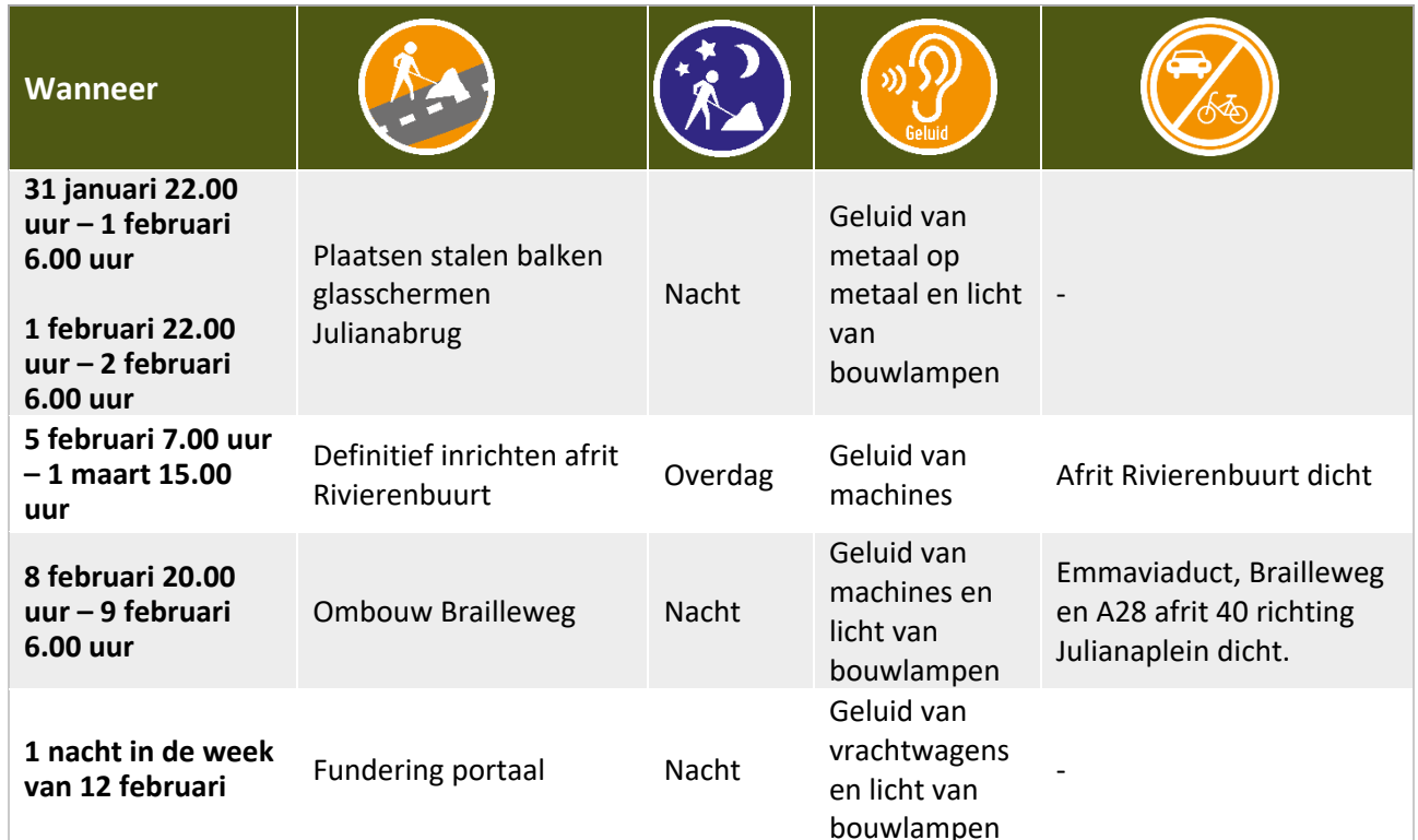
Tabel Werkzaamheden en hinder tot 16 februari 2024

De data zijn onder voorbehoud. Werkzaamheden met de vermelding 'Overdag' en overige werkzaamheden voeren we uit op maandag tot en met zaterdag tussen 07.00 uur en 19.00 uur. Wilt u op de hoogte blijven van veranderingen in de planning? Meld u zich dan voor onze SMS-service: www.aanpakringzuid.nl/aanmelden