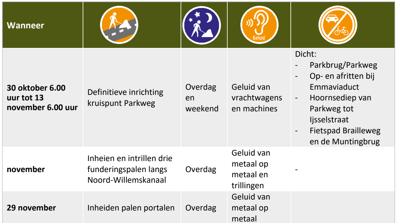
Tabel Werkzaamheden en hinder tot 22 december 2023

De data zijn onder voorbehoud. Werkzaamheden met de vermelding 'Overdag' en overige werkzaamheden voeren we uit op maandag tot en met zaterdag tussen 07.00 uur en 19.00 uur. Wilt u op de hoogte blijven van veranderingen in de planning? Meld u zich dan voor onze SMS-service: www.aanpakringzuid.nl/aanmelden