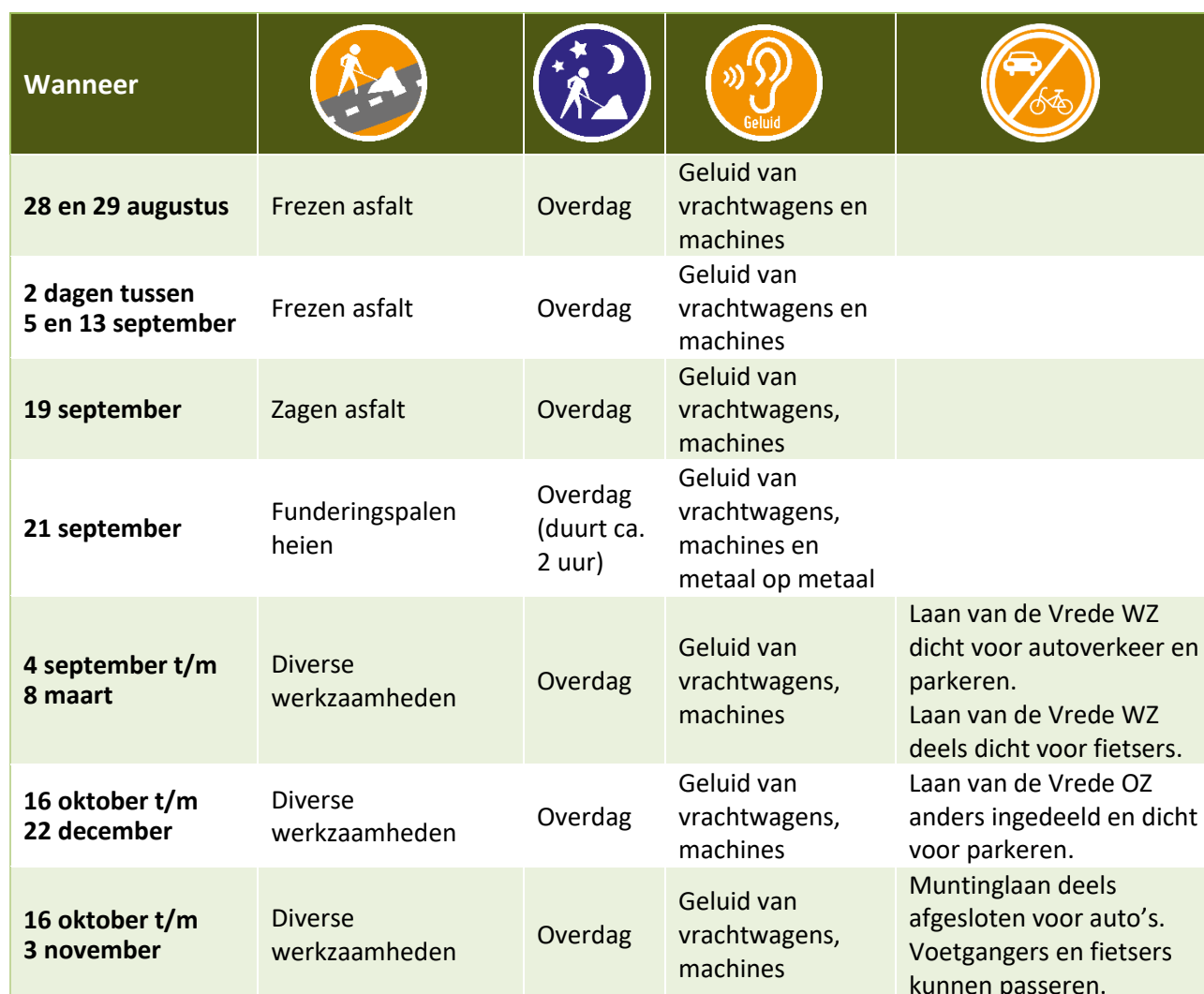
Tabel werkzaamheden en hinder tot en met oktober 2023

De data zijn onder voorbehoud. Werkzaamheden met de vermelding 'Overdag' en overige werkzaamheden voeren we uit op maandag tot en met zaterdag tussen 07.00 uur en 19.00 uur. Wilt u op de hoogte blijven van veranderingen in de planning? Meld u zich dan voor onze SMS-service: www.aanpakringzuid.nl/aanmelden