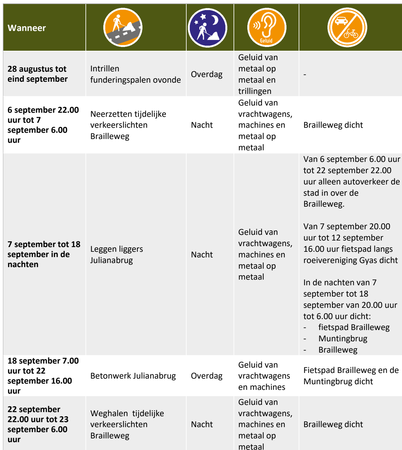
Tabel Werkzaamheden en hinder tot oktober 2023

De data zijn onder voorbehoud. Werkzaamheden met de vermelding 'Overdag' en overige werkzaamheden voeren we uit op maandag tot en met zaterdag tussen 07.00 uur en 19.00 uur. Wilt u op de hoogte blijven van veranderingen in de planning? Meld u zich dan voor onze SMS-service: www.aanpakringzuid.nl/aanmelden