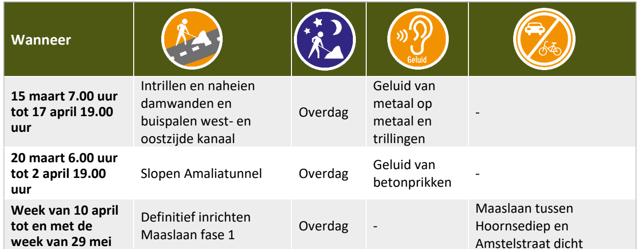
Tabel Werkzaamheden en hinder tot juni 2023

De data zijn onder voorbehoud. Werkzaamheden met de vermelding 'Overdag' en overige werkzaamheden voeren we uit op maandag tot en met zaterdag tussen 07.00 uur en 19.00 uur. Wilt u op de hoogte blijven van veranderingen in de planning? Meld u zich dan voor onze SMS-service: www.aanpakringzuid.nl/aanmelden