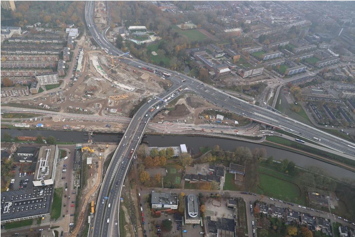
De eerste boog vol beton wordt al duidelijk zichtbaar op het Julianaplein; dit is de bocht die het meest diep ligt en loopt van Hoogezand richting Assen.

Tot slot: het Julianaplein als centraal punt in de werkzaamheden is rond de kerst gebruikt om alle inwoners van Groningen en de regio te bedanken voor hun medewerking en welwillendheid (om om te rijden) door het plaatsen van een reuzenrad. Dat rad is mogelijk gemaakt door onderaannemers en relaties van CHP, Gastvrij Groningen en Groningen Bereikbaar.