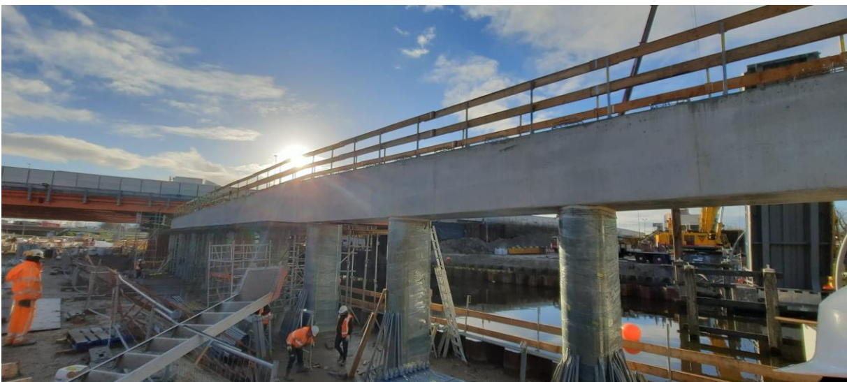
Tussensteunpunt nieuwe Julianabrug.