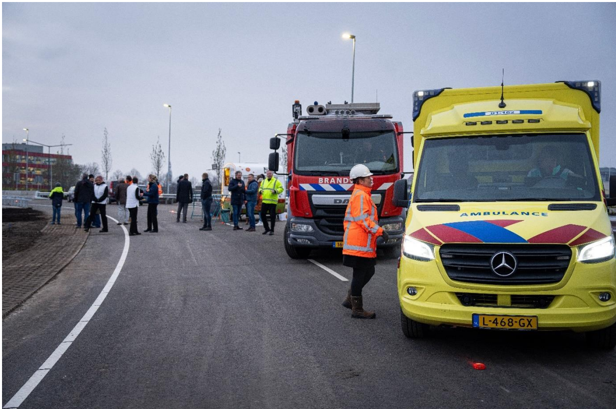
Opening van de nieuwe afrit bij de skivijver op vrijdag 2 december.

Daardoor is ook meteen begonnen aan het afbreken van de oude afrit richting het Europaplein. Deze ruimte is nodig voor de 'uitgang' van de verdiepte ligging. Of de ingang, vanuit Hoogezand bekeken. Verder wordt er gewerkt aan de afrit aan de andere zijde bij de Lübeckweg. Onder het viaduct is inmiddels aan beide kanten grafisch beton aangebracht: afbeeldingen die de historie van dat gebied aantonen. Zo zijn de vijf pijpen van de energiecentrale te ontwaren, en de elftalfoto van FC Groningen dat net de winst in de bekerfinale heeft behaald.