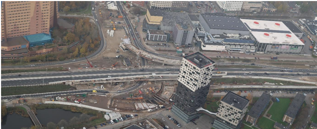
De duidelijk van elkaar gescheiden rijbanen om in het midden de werkzaamheden ten behoeve van een nieuw viaduct te verrichten bij het Vrijheidsplein.

Ook deze periode is de meeste druk op verkeer en omgeving weer in dit cluster geweest. De renovatie van het viaduct over de busbaan Hoogkerk-Peize duurde langer dan verwacht. Eind november is de afrit daardoor pas weer opengestaan voor verkeer. Ondertussen is op dat gedeelte van de A7 het verkeerssysteem omgezet; van Drachten naar Groningen zijn smallere banen beschikbaar. De banen richting Drachten zijn gesplitst. Daartussen wordt gewerkt aan beide Hoogkerk-viaducten. De aanblik op de westelijke ring verandert met de week: daar wordt hard gewerkt aan het nieuwe viaduct tussen de Leonard Springerlaan en Gasunie. De rijstroken blijven tot en met 2024 aangepast. Het tweede viaduct op de westelijke ringweg, die over de Concourslaan loopt, wordt afgebroken en vervangen door een compleet nieuw viaduct. Daardoor zijn er zeker voor auto's, maar meerdere keren ook voor fietsers en voetgangers stremmingen in het Stadspark. Vanwege de andere afsluitingen, hebben omleidingen behoorlijke impact. Het goede nieuws aan deze kant van de werkzaamheden: de Piccardthoftunnel is gereed na maandenlang werk. Er is een uitdeelactie geweest om de fietsers ter plekke te bedanken.