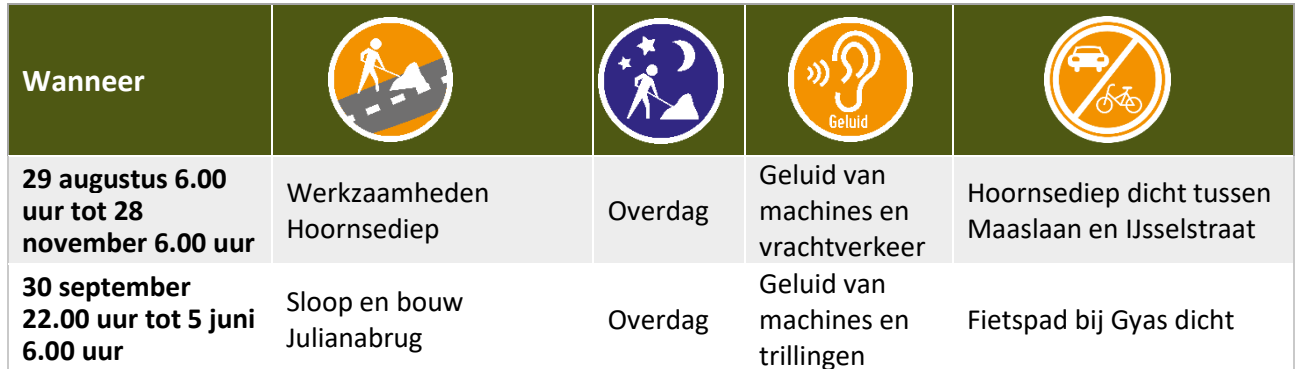
Tabel hinder 29 augustus – 5 juni

De data zijn onder voorbehoud. Overige werkzaamheden voeren we uit op maandag tot en met zaterdag tussen 07.00 uur en 19.00 uur.