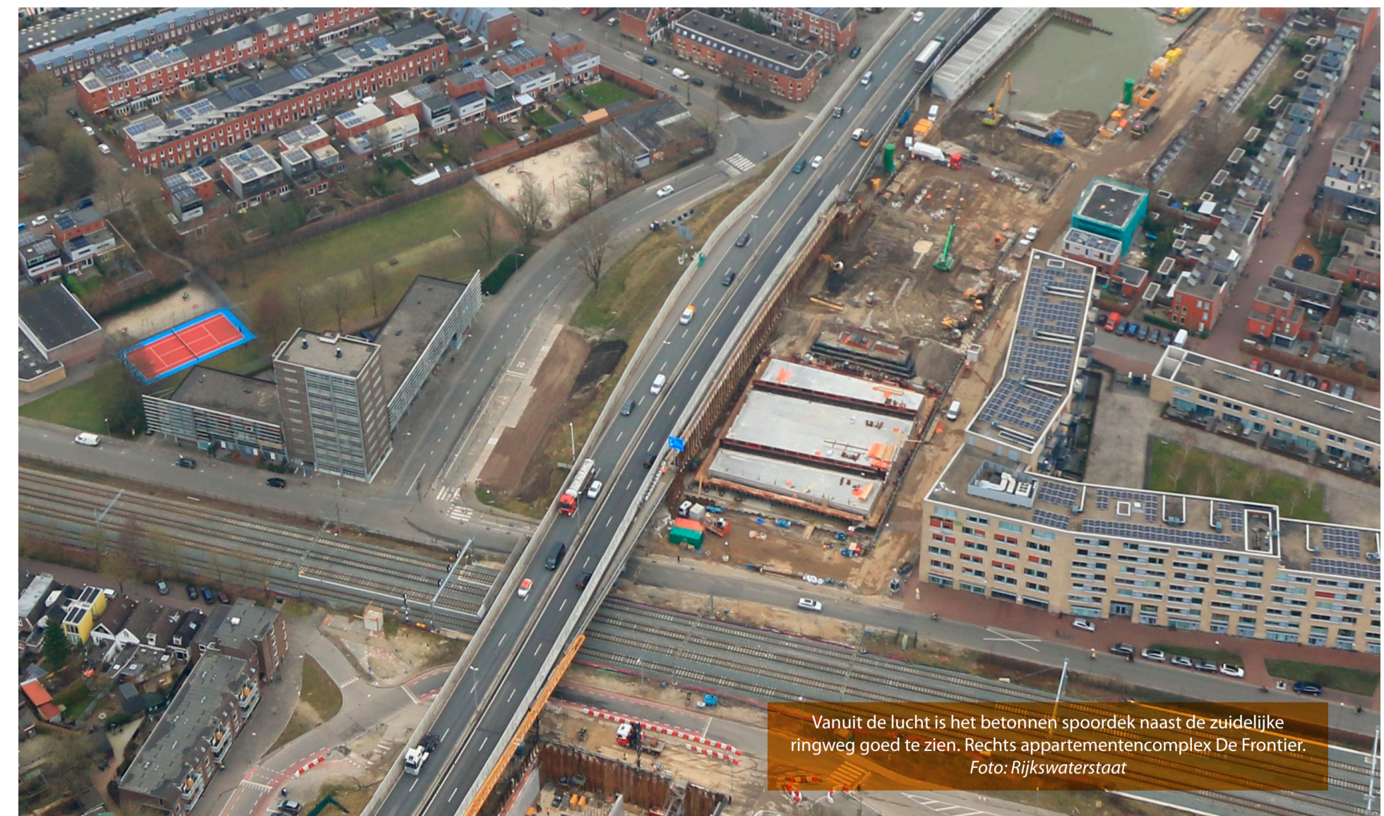
Vanuit de lucht is het betonnen spoordek naast de zuidelijke ringweg goed te zien. Rechts appartementencomplex De Frontier.

Voordat het inrijden van het spoordek van start kan gaan, staan er nog diverse voorbereidende werkzaamheden op de planning. Daar ondervindt het verkeer hinder van. Voor autoverkeer is de Verlengde Lodewijkstraat ter hoogte van De Frontier afgesloten vanaf vrijdag 2 april (23.00 uur) tot zondag 23 mei (23.00 uur). Voor fietsers en voetgangers is de Verlengde Lodewijkstraat dicht vanaf maandag 19 april (07.00 uur) tot zondag 23 mei (23.00 uur). Aan de andere kant van het spoor is de Helperzoom vanaf 7 april (7.00 uur) tot 23 mei (23.00 uur) dicht voor autoverkeer. Hier kunnen fietsers en voetgangers wel passeren, behalve in twee weekenden: 9-12 april en 30 april-3 mei.