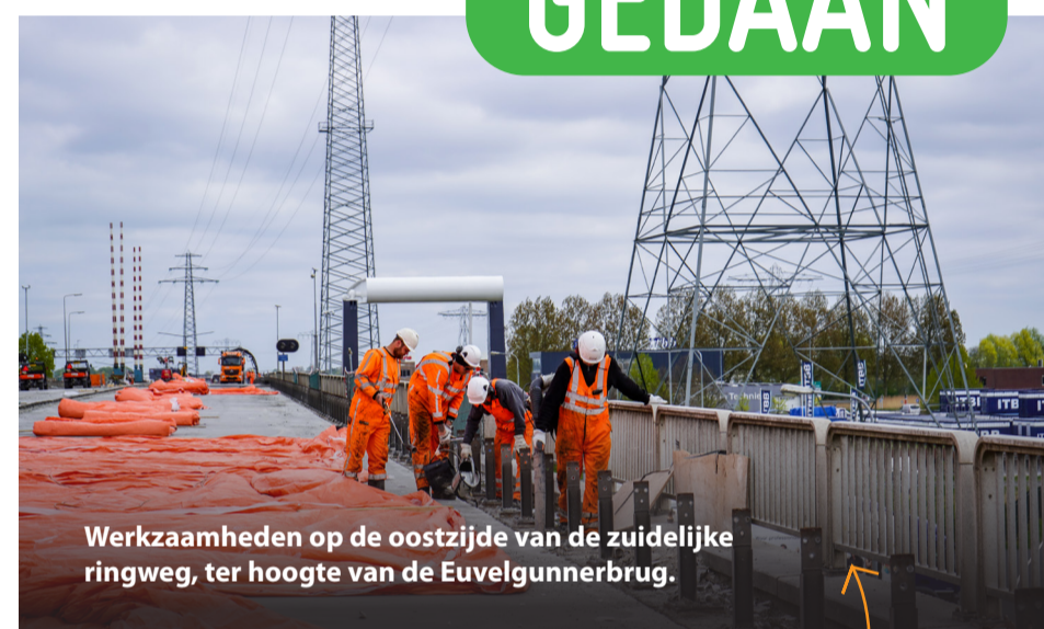
Werkzaamheden op de oostzijde van de zuidelijke ringweg, ter hoogte van de Euvelgunnerbrug.