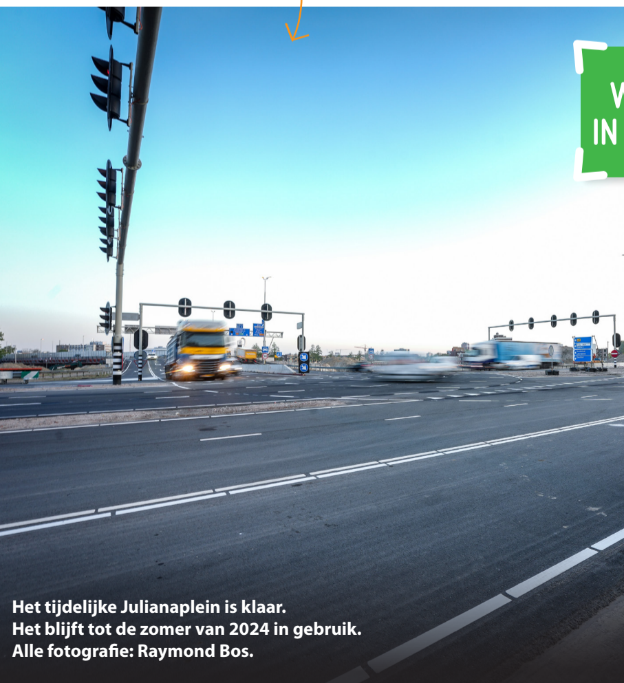
Het tijdelijke Julianaplein is klaar. Het blijft tot de zomer van 2024 in gebruik.

De oostzijde van de zuidelijke ringweg is dit voorjaar helemaal vernieuwd. Dat kon, omdat er geen verkeer reed in verband met Operatie Julianaplein. Het gaat om het stuk weg tussen de Europaweg en aansluiting Euvelgunne. Hier wordt de weg verbreed. De weg is helemaal opnieuw geasfalteerd. Ook zijn er nieuwe lantaarnpalen geplaatst en een nieuwe vangrail.