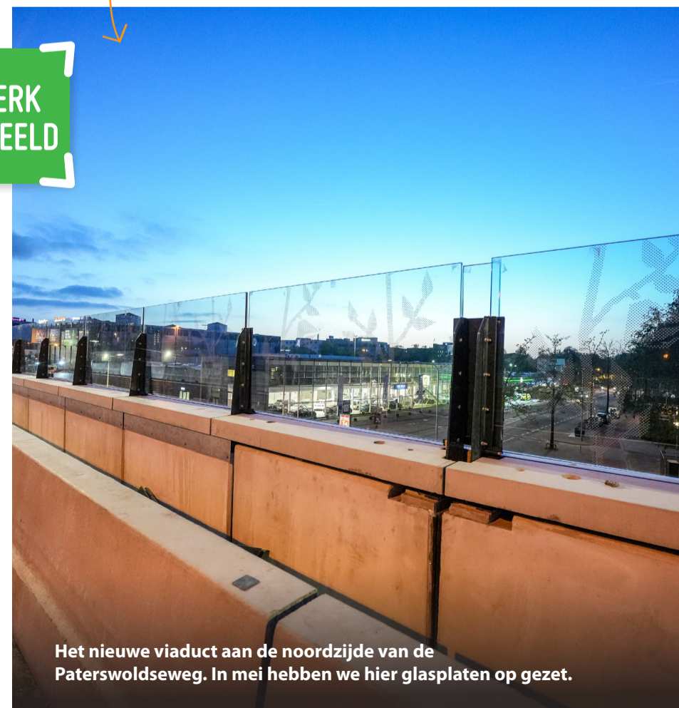
Het nieuwe viaduct aan de noordzijde van de Paterswoldseweg. In mei hebben we hier glasplaten op gezet.