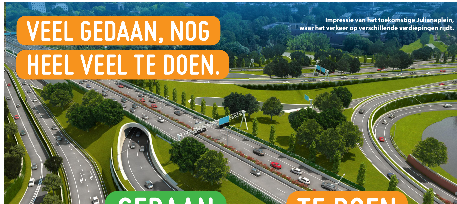
Impressie van het toekomstige Julianaplein, waar het verkeer op verschillende verdiepingen rijdt.