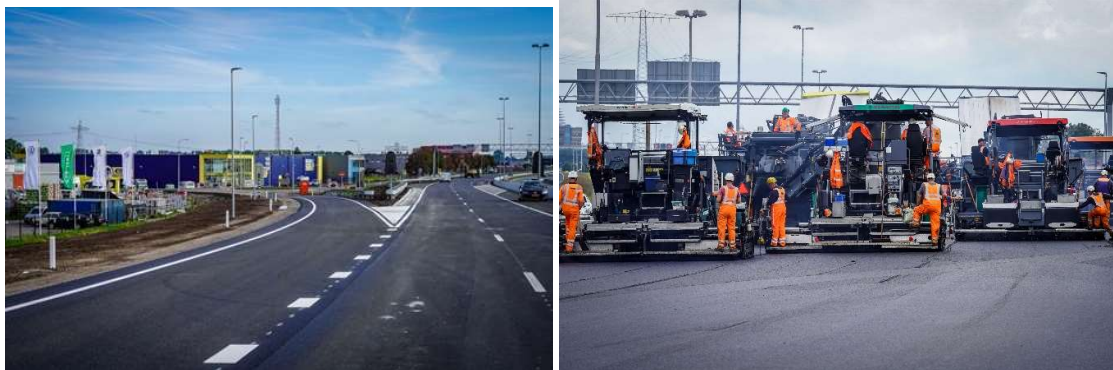
Nieuwe op-en afrit Stettinweg en asfalteren noordbaan tussen Euvelgunne en Europaplein

Bij de Stettinweg zijn de nieuwe op- en afrit gerealiseerd. De bedrijventerreinen Eemspoort en Driebond zijn nu sneller en eenvoudiger te bereiken. Bij de rotondes bij de Gotenburgweg/Osloweg verbreden we het viaduct. De fundering is de afgelopen periode aangebracht.