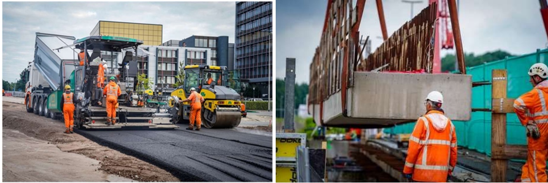
Aanleg tijdelijke wegen Vrijheidsplein en verbreden viaduct Laan Corpus den Hoorn

aangelegd. Het viaduct over de aan Corpus den Hoorn is verbreed aan de noord- en zuidzijde van de N7. Meer informatie en een uitgebreid overzicht van de werkzaamheden vindt u op de website van Aanpak Ring Zuid.