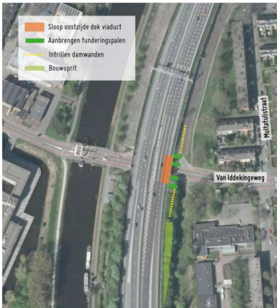
Locatie werkzaamheden viaduct Van Iddekingeweg