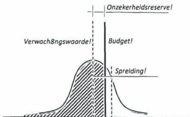
Afbeelding 3, raming en budget

Bij de ontwikkeling van het project is uitgegaan van de werkwijze van RWS. Dit betekent dat bij de beoordeling van de kostenraming ten opzichte van het beschikbare budget steeds is uitgegaan van de verwachtingswaarde van de raming. Voor RWS is dit een logische methode, omdat zij verantwoordelijk is voor meerdere grote projecten, waarbij het beleid is gekozen dat tegenvallers op het niveau van de projectenportefeuille moeten worden gecompenseerd uit meevallers. Door geen rekening te houden met de spreiding wordt voorkomen dat een opeenstapeling van financiële buffers over de projecten plaatsvindt.