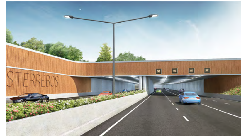
Impressie verdiepte ligging in de eindsituatie: ingang west, kruising Hereweg