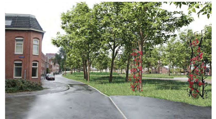
Impressie van het Zuiderplantsoen in de eindsituatie, gezien vanaf de Meeuwerderbaan