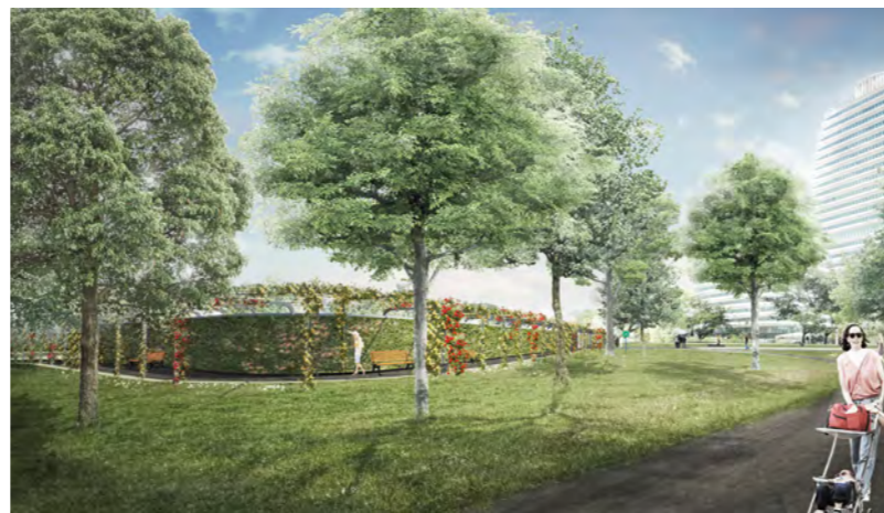
Impressie Zuiderplantsoen in de eindsituatie: ter hoogte van het DUO-gebouw

Een nieuwe fietstunnel onder het spoor op de plek van de huidige Esperantokruising, die dicht gaat.