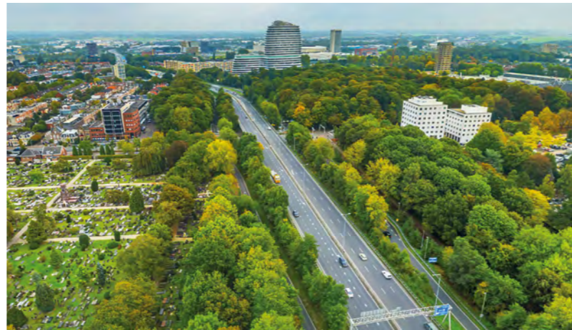
De huidige zuidelijke ringweg ter hoogte van de Hereweg, kijkend naar het oosten