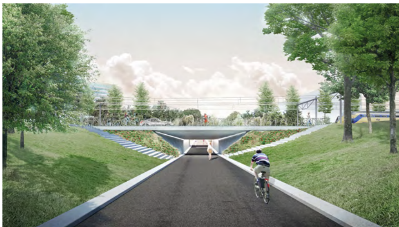
Impressie extra wens fietstunnel Esperantostraat in de eindsituatie