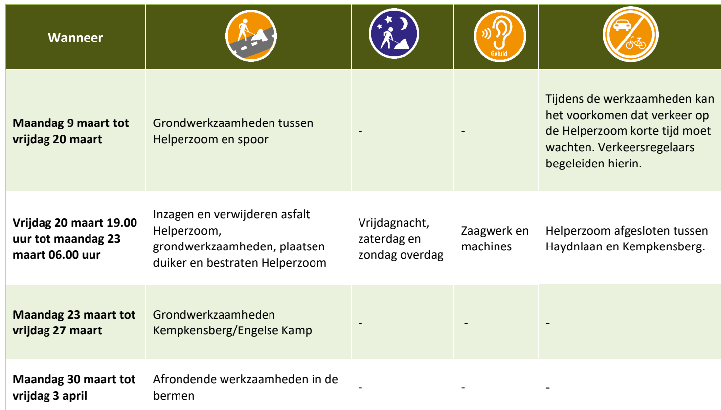
Tabel: Overzicht werkzaamheden van 9 maart tot 3 april 2020