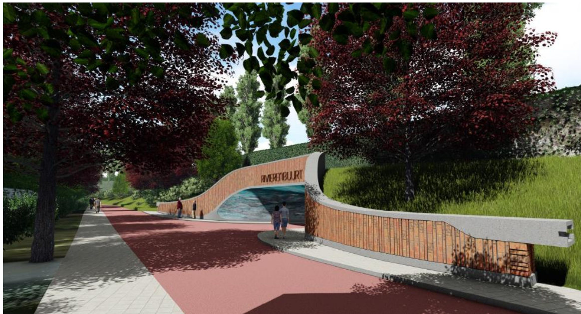
Figuur 2: Impressie ingang fietstunnel zuidzijde N7 ter hoogte van de Papiermolenlaan

Vanwege de aanleg van de fietstunnel wordt de wegas van de verbindingsweg tussen Brailleweg en Hereweg (noordzijde N7) verhoogd van ongeveer km 197,3 (Europaplein) tot km 197,85 (Hereweg). De verbindingsweg is weergegeven op detailkaarten 06b en 09b. De verhoging is op het hoogste punt ter hoogte van de fietstunnel iets meer dan 2 meter in vergelijking met het vigerende 'Tracébesluit 2014'. De verhoging van de wegas betreft alleen de verbindingsweg tussen Brailleweg en Hereweg. De hoofdrijbaan van de N7 en de twee verbindingswegen tussen N7 en A28 worden niet aangepast.