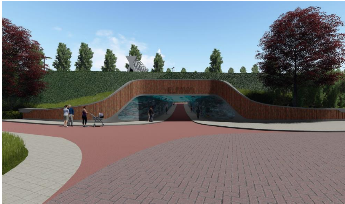
Figuur 1: Impressie ingang fietstunnel noordzijde N7 ter hoogte van de Merwedestraat