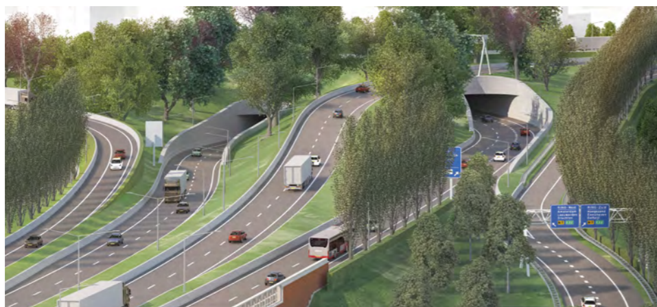
Impressie Julianaplein in de eindsituatie gezien vanaf de A28