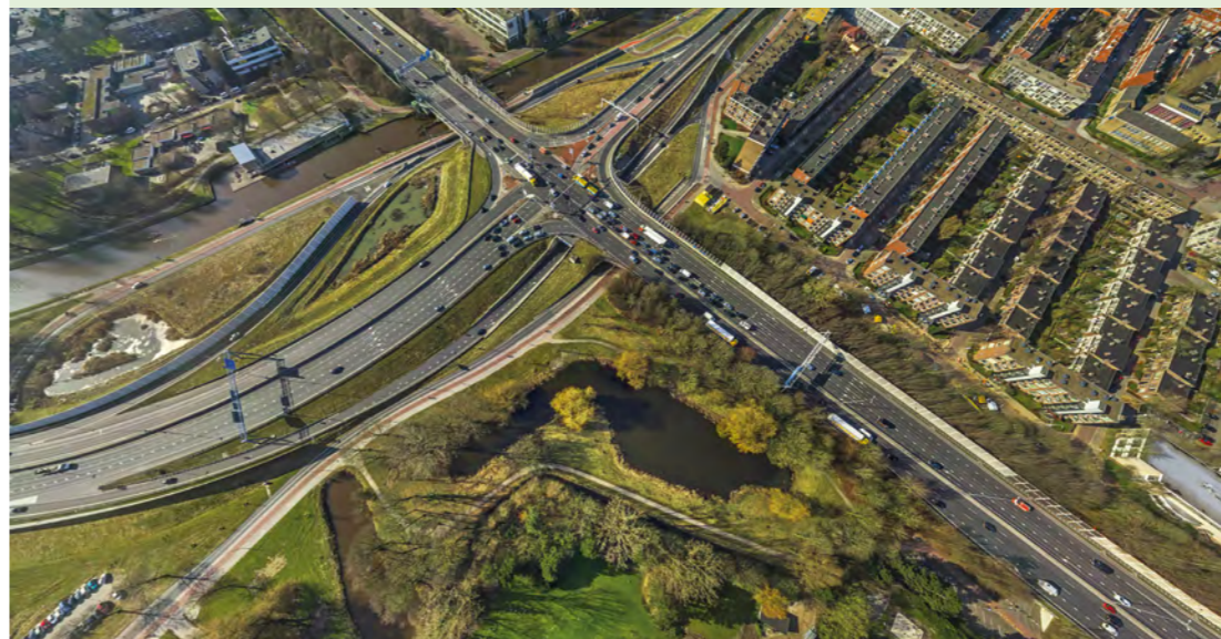
Het huidige Julianaplein

Extra pakket maatregelen om de zuidelijke ringweg nog groener en duurzamer te maken. Een van de maatregelen is een groenere aankleding van het Julianaplein.