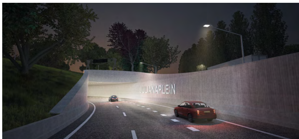
Impressie Julianaplein in de eindsituatie