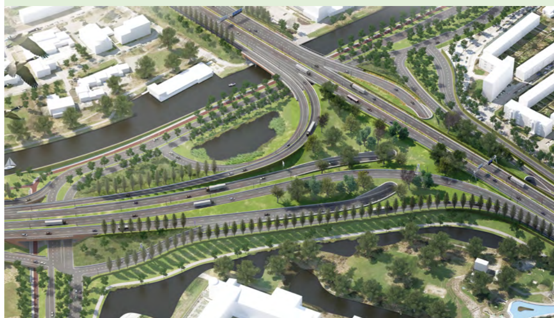
Impressie van het Julianaplein in de eindsituatie, inclusief wens groenere aankleding