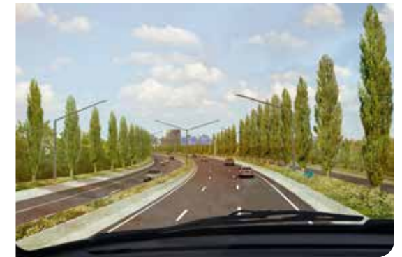
Impressie van de groene parkway van de zuidelijke ringweg.