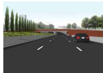
Inrit verdiepte ligging vanuit oostelijke richting.