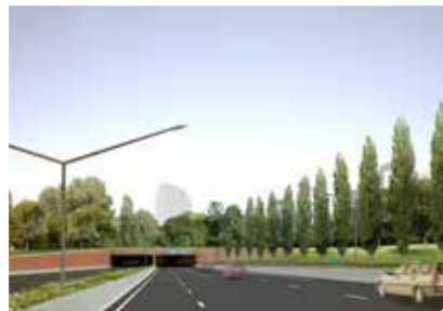
Impressie van de verdiepte ligging bij de Hereweg.

De inritten van de verdiepte ligging zijn het visitekaartje van de stad. Ze worden bekleed met gemetselde baksteen. De bomenrij loopt door tot aan het begin van de verdiepte ligging. Het talud (de schuine helling) achter de bomenrij is een wens (optimalisatie Groene plus).